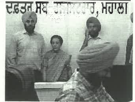
EO GMADA MOHALI (Colonizer/Company )